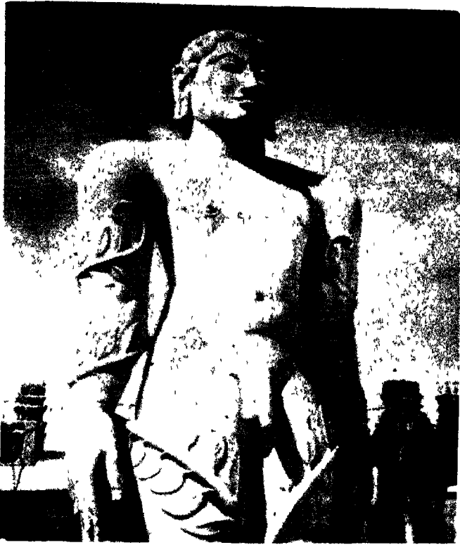
विश्व का द्वां आश्चर्य, ५७ फीट ऊंची बाहुबली की मूर्ति श्रवणवेलगोल, मैसूर राज्य में उत्कीर्णित

सम्राट् ऋषभदेव के दूसरे पुत्र बाहुबली थे। वे भी भरत की भाँति प्रतापी थे। उनका जन्म ऋषभदेव की द्वितीय पत्नी सुनन्दा से हुआ था। उनका शरीर कामदेव के समान सुन्दर था। इसी कारण वे गोम्भटेश कहलाते थे। वे दृढ तपस्वी और मोक्षगामी महासत्त्व थे। उनकी राजधानी तक्षशिला (पोदनपुर) में थी।